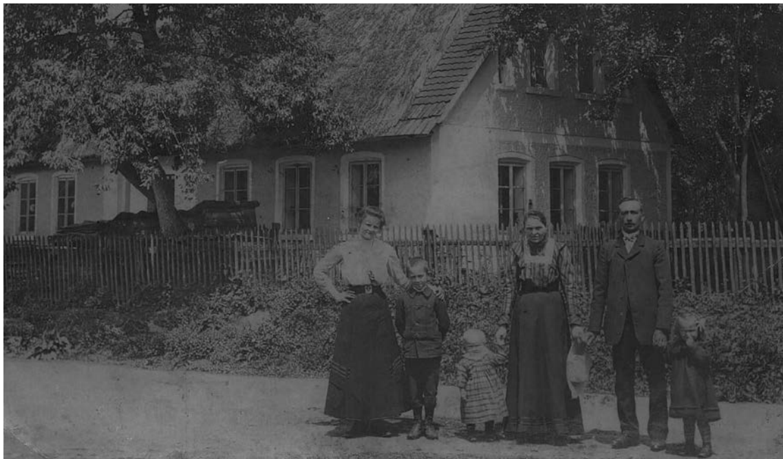
▲ Zdjęcie z 1910 r., a na nim mieszkańcy Stonego przed domem, ul. Stone 112.