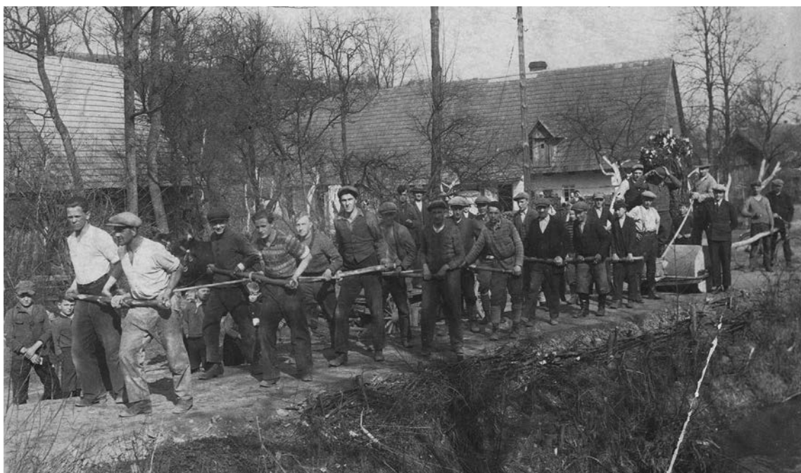
▲ Zdjęcie z lat '30 XX w., a na nim mieszkańcy Stonego budujący wspólnymi siłami wał przeciwpowodziowy wzdłuż rzeki Klikawy.